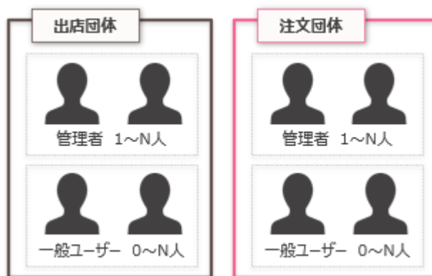
図 1. 団体とユーザーの概要図