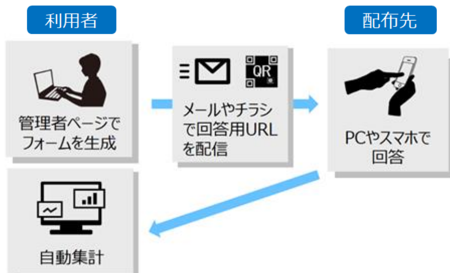
図 1. Form@ サービス概要図